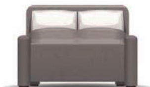
Na měkké posteli